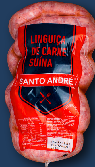
LINGUIÇA DE CARNE SUÍNA