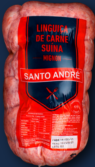
LINGUIÇA DE CARNE SUÍNA mignon